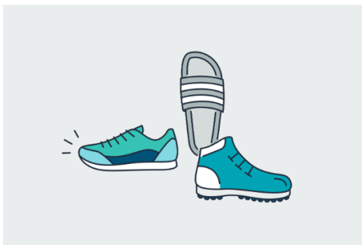
フィットネスシューズ