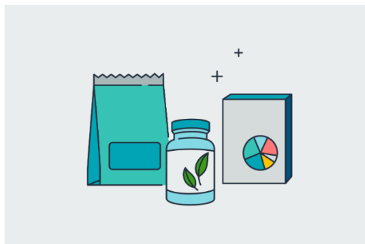
サプリメント・ビタミン